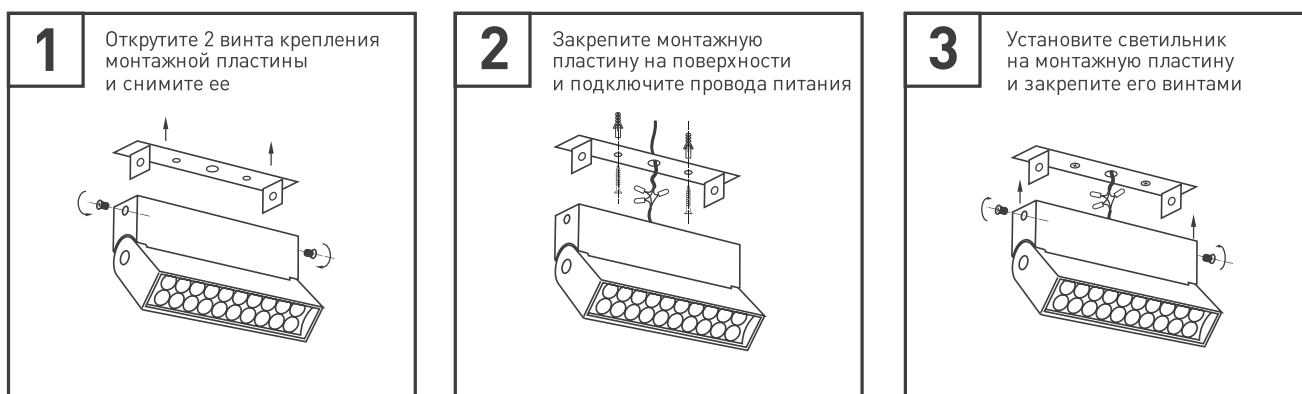
Рис. 2. Установка и подключение светильника